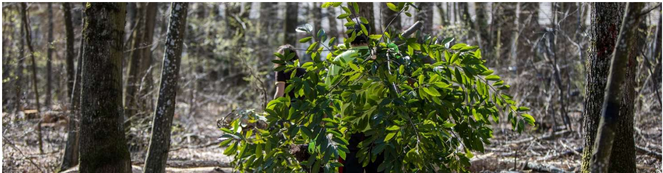
Projet Laureelles – Veyrier (GE)

«Anrede» «Vorname» «Nachname» «Strasse» «Land» – «Postleitzahl» «Ort»