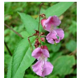
Projet Balsamine de l'Himalaya le long de la Glâne (FR)