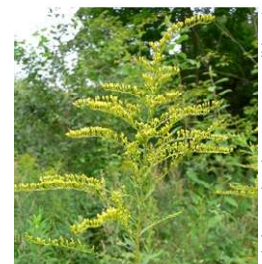
Projet Solidage du Canada Berolle (VD)