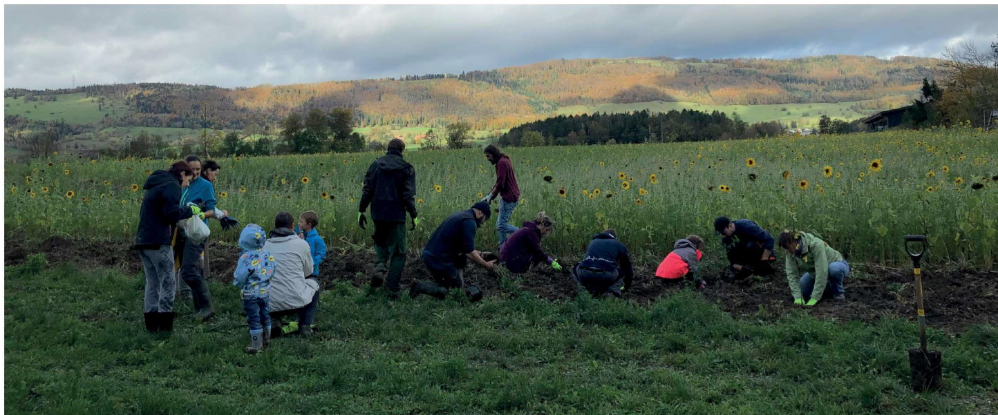
Plantation de haie, Berlincourt, novembre 2019

Edition 1 / 2020 | WWF Jura | Case postale 2328 | 2800 Delémont 2 | Téléphone 076 412 69 83 Courriel: info@wwf-ju.ch | Web: wwf-ju.ch | CCP 25-1852-2