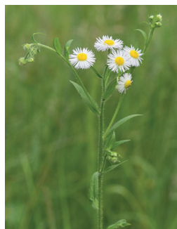
◀ Vergerette annuelle